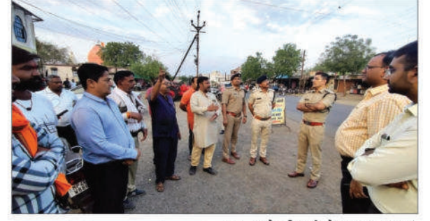
माही की गूंज, बड़वानी।

आगामी त्यौहार को देखते हुए कलेक्टर और एसपी ने लिया शहर की व्यवस्थाओं का जायजा