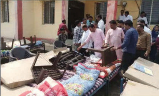
धार जिले की मनावद विधानसभा में होने वाले मुख्यमंत्री कन्या विवाह आयोजन में बाहरी फर्मों द्वारा इस तरह से घटिया सामग्री दी गई। जिस पर जनप्रतिनिधियों ने आपत्ती लेते हुए आयोजन को निरस्त करवाया।

अब भ्रष्टाचार को जड़ से मिटाने की बात करने वाली