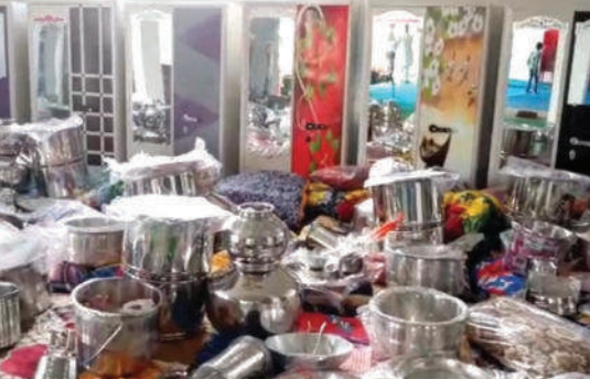
गौतम द्वारा किए गए आयोजन में बदनावर तहसील की ग्राम पंचायत खेड़ा में वैवाहिक आयोजन में नव विवाहित जोड़ी को दी गई ग्रहस्त्री की समस्त सामग्री।

मनावर विधानसभा में सामाजिक न्याय व निश्चकन कल्याण विभाग की ओर से मुख्यमंत्री कन्यादान विवाह निकाह योजना में देने वाली सामग्री में हुए भारी भ्रष्टाचार को लेकर कार्यालय जनपद पंचायत उरमखन की ओर से पत्र जारी कर देने वाले सामूहिक विवाह आयोजन को स्थगित किया गया। पत्र में लिखा है कि गत दिनों जनपद