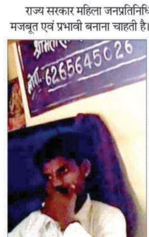
माही की गूंज, रतलाम।

राज्य सरकार महिला जनप्रतिनिधियों को ज्यादा मजबूत एवं प्रभावी बनाना चाहती है। पंचायतीराज विभाग इस दिशा में प. भा. वी. कदम उठाया है। पंचायतीराज चुनाव में शैक्षणिक योग्यता लागू होने से पहले तक ग्राम पंचायतों में महिला सरपंचों की संख्या कम थी। सरपंचों की जगह उनके पति ही सरपंचाई कर रहे हैं पहले बहाना था कि अनपढ़ होने के कारण वह कामकाज नहीं कर सकती। नए आदेश के तहत निकट संबंधी और रिश्तेदार पंचायतों की बैठकों में भाग ले रहे हों या उनके कार्यालय का कार्य संपादित कर रहे हों तो गलत है। शासन नियमानुसार तो सिर्फ पंचायत में जो सरपंच है। वहीं पंचायत में आकर अपना काम स्वयं करे और परिवार के कोई भी व्यक्ति पंचायत में प्रतिनिधि के तौर पर भी हस्तक्षेप नहीं कर सकते हैं।